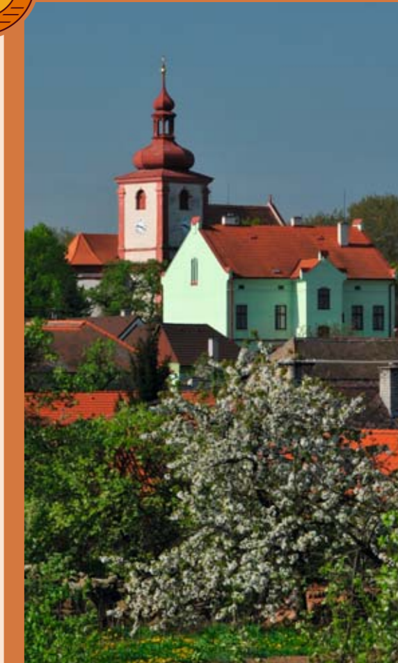
Věž kostela sv. Jana Křtitele v období rozkvetlého jara