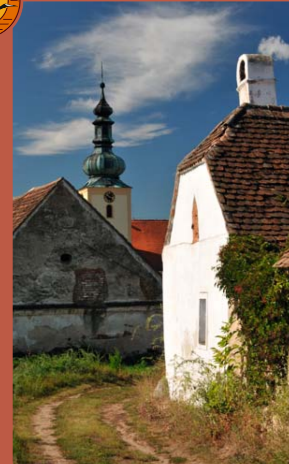
Věž kostela sv. Zikmunda nad popickými stodolami