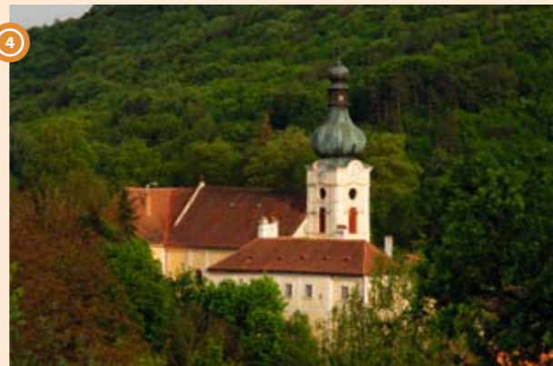
4 Kostel Nanebevzetí Panny Marie je jen zdánlivě ukryt v lesích národního parku

Samozřejmě se stejně výrazně jako na vzhledu zámku podepisovali majitelé panství i na životě města pod skalou. Po třicetileté válce (1618 - 1648) se znovu začala na Vranovsku