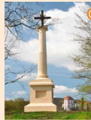
5 Mniszkův kříž byl vybudován naproti vranovskému zámku v roce 1846

Kostel je dominantou vranovského náměstí. Původ románsko-gotické stavby sahá do 13. století. Švédové ji neušetřili, ale Althannové, tehdejší majitelé panství, sakrální stavbu na