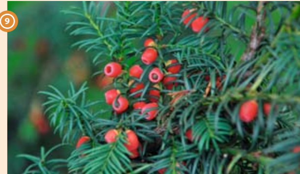
9 Ve stinných lesích na strmých stránkách Vranovska se vzácně vyskytuje tis červený

Největší relativní převýšení v rámci celého Národního parku Podyjí má údolí v lokalitě Braitava – 235 metrů. Braitava je nejrozsáhlejší a nejzachovalejší komplex přírodních